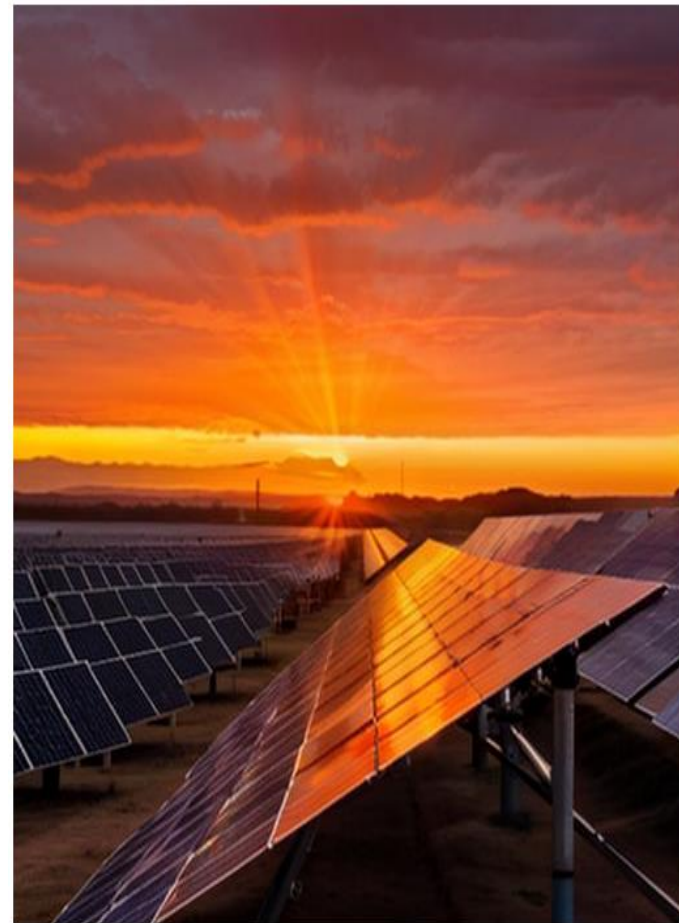
Abbildung erstellt mit: playground.com/create